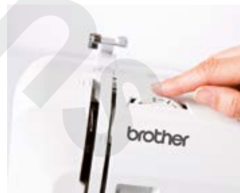
Ajustement de la tension du fil

Pour plus d'informations, contactez votre Spécialiste ou rendez-vous sur sewingcraft.brother.eu .