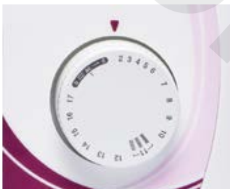
Commande simple de sélection des points