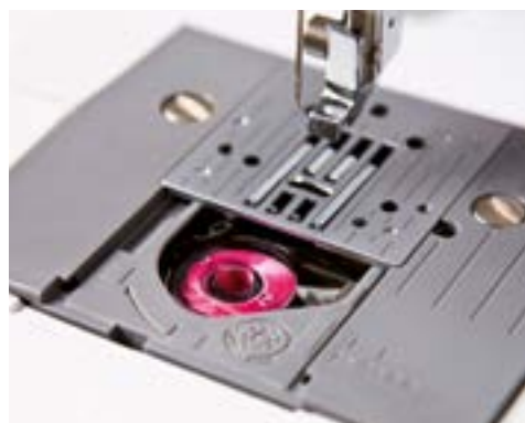
Mise en place rapide de la canette