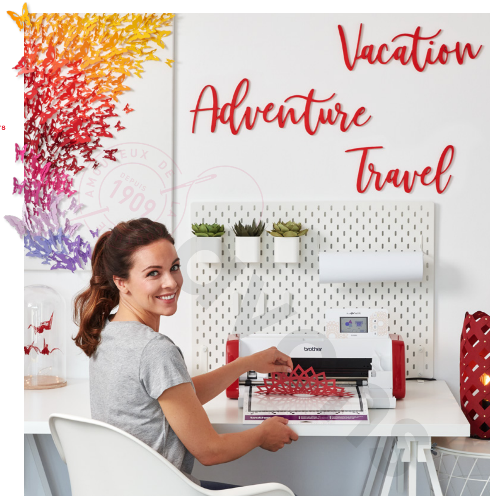
Vacation = Vacances / Adventure = Aventure / Travel = Voyage

Dédiez votre temps à la création ! La SDX900 lit les fichiers SVG - sans conversion préalable.