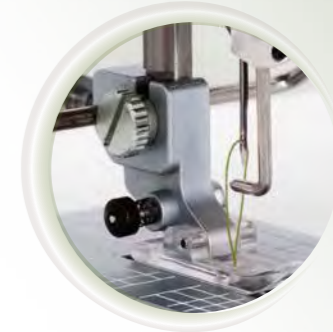
Système spécial d'alimentation du fil