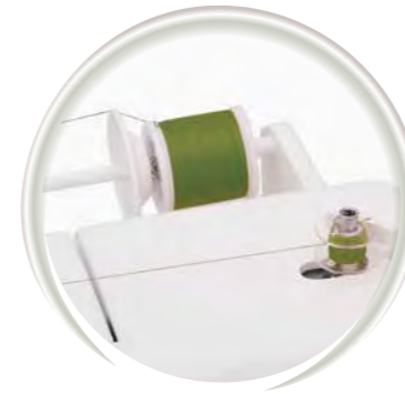
Bobinoir à fils