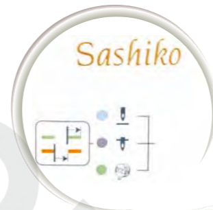
Touche de fonction pour aiguille position haute/basse