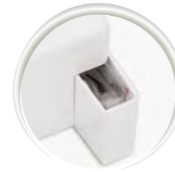
Compartiment pour accessoires intégré

baby lock Campus Conseils et astuces pour des loisirs créatifs... Vous pouvez télécharger gratuitement nos instructions et les utiliser. www.babylock.fr/campus