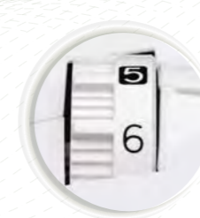
Pression du pied-de-biche et épaisseur du tissu