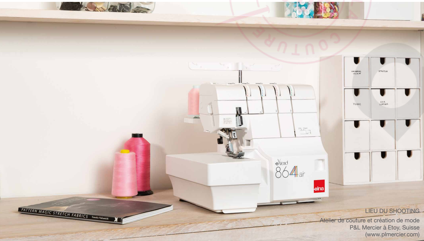
LIEU DU SHOOTING Atelier de couture et création de mode P&L Mercier à Etoy, Suisse (www.plmercier.com)

Nous avons lancé notre eXtend 864air pour vous offrir une expérience du surjet plus agréable que jamais. Ce modèle haut de gamme dispose à la fois de capacités exceptionnelles et de solutions d'enfilage extrêmement faciles. Il ne vous reste plus qu'à vous détendre, à démarrer votre projet et à profiter de tous ses avantages.